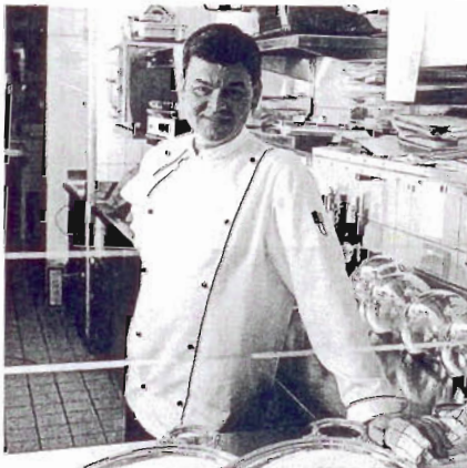
Er lernte bei Eckart Witzigmann und gilt als Deutschlands bester Koch: Auch Harald Wohlfahrt ist dreifach besternt. Nur ein Hype der Gastrokritiker?

Stil entwickelt hat, der von den marktherrschenden Eliten als große Kunst erkannt und gefeiert wird. Und wer einmal drei Sterne oder zehn Hauben hat, wird ebenso wenig kritisiert wie die Beutekunst der großen Sammler.